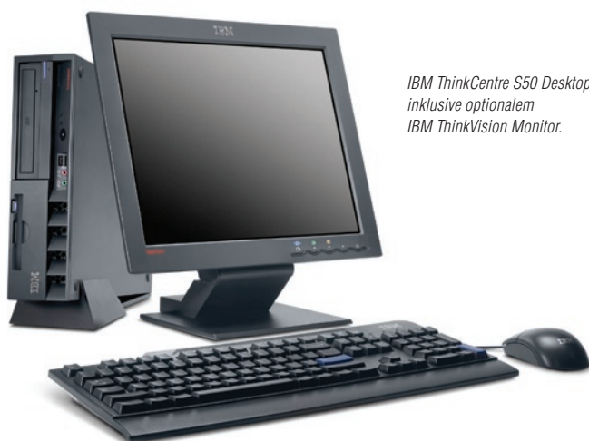
IBM ThinkCentre S50 Desktop inklusive optionalem IBM ThinkVision Monitor.

IBM empfiehlt Microsoft® Windows® XP Professional für Unternehmen.