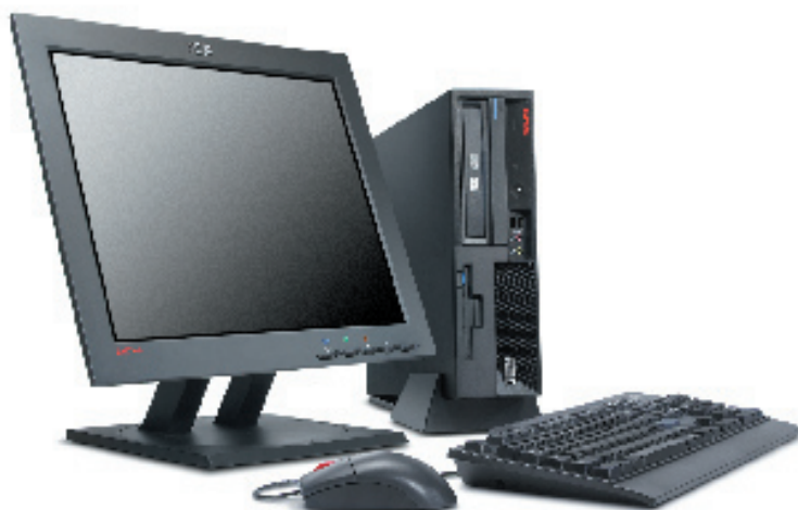
ThinkCentre M52 mit optionalem ThinkVision Monitor

Stabilität und Verwaltungsfähigkeit für Ihr Unternehmen