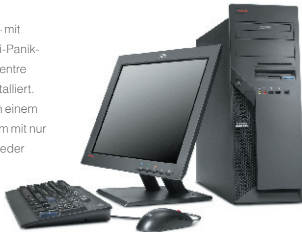
ThinkCentre M52 Tower mit optionalem ThinkVision Bildschirm

ThinkCentre empfiehlt Microsoft® Windows® XP Professional für Unternehmen.