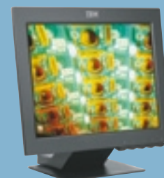
NEU! Ihr Einstieg in die Flachbildschirmtechnologie: T541