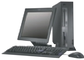
NetVista M und A Serie Small Desktop