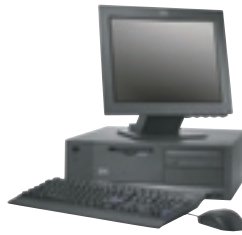
NetVista M und A Serie Desktop