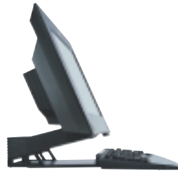
NetVista X Serie Desktop