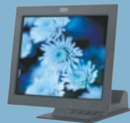
NEU! Der T560 Flachbildschirm zeigt sich unglaublich beweglich.