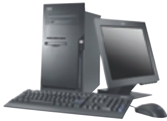
NetVista M und A Serie Tower