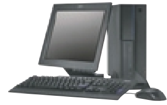
NetVista M Serie Mini Desktop