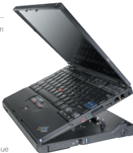
ThinkPad X41/X40 Notebook mit einer optionalen ThinkPad X4 UltraBase und einem DVD-ROM UltraBay Slim-Laufwerk.

ThinkPad empfiehlt Windows® XP Professional.